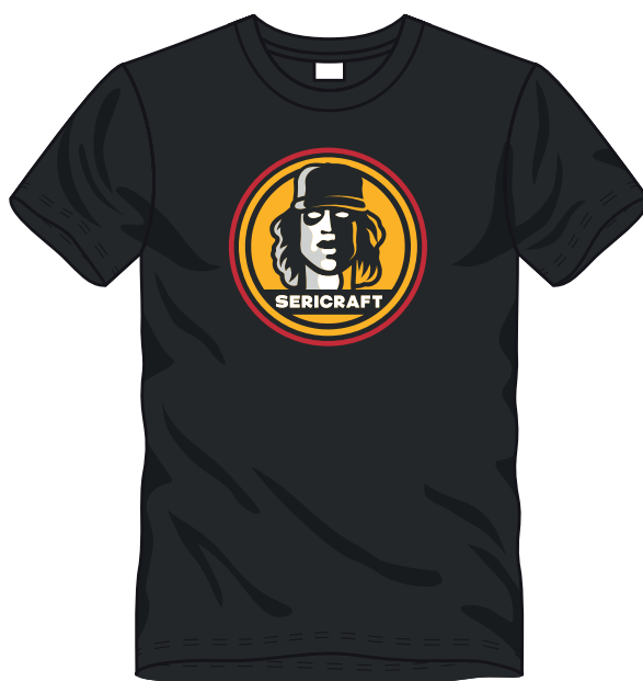
■ ■ ■ ■ 4 COLORI