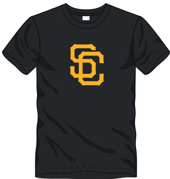
■ 1 COLORE

Ecco alcuni esempi per aiutarti a capire a quanti colori è la grafica che vuoi stampare. Ricordati che i colori che visualizzi nel tuo schermo possono variare in base alla tipologia e alla risoluzione del tuo monitor. Se hai esigenze particolari, con un piccolo sovrapprezzo, potrai inserire dei codici pantone, altrimenti fidati di noi, con la nostra esperienza realizzeremo al meglio il tuo lavoro.