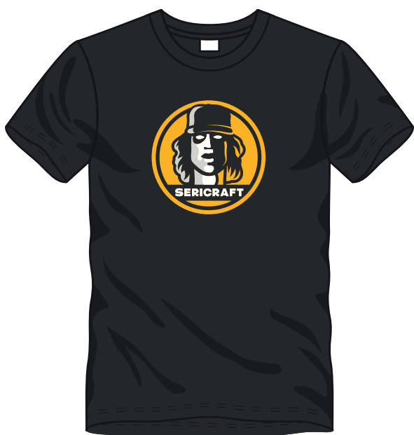
■ ■ ■ 3 COLORI