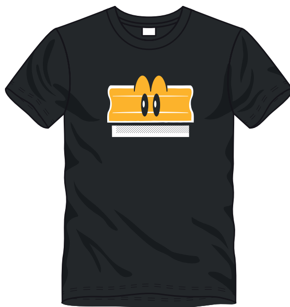
■ ■ 2 COLORI